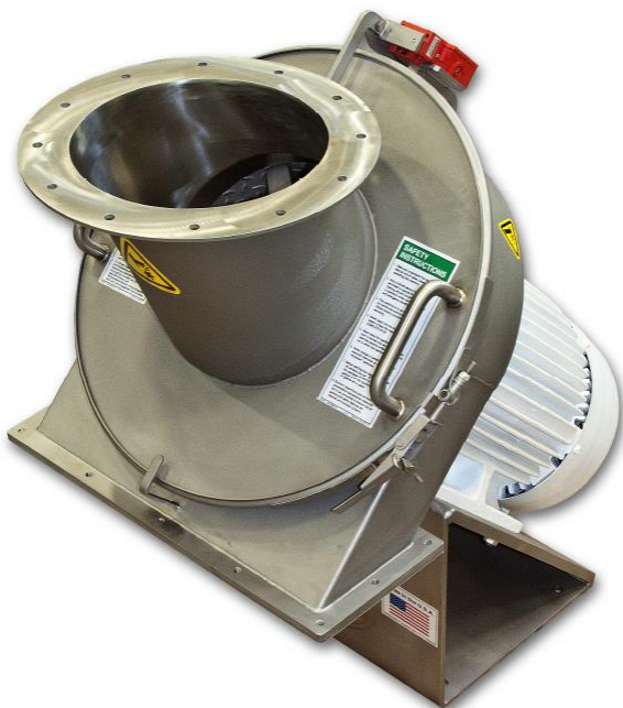
Model RP12(기능성 식품 분쇄용)

많은 종류의 스크린 타입으로 다양한 분쇄품질의 제공이 가능합니다. 예를 들면, 단순한 원형, 사각형부터 줄 타입의 hole까지 다양합니다. 해머는 무딘 것부터 날카로운 것까지 다양하며, 이로 인해 원하는 최종 제품의 생산이 가능하게 합니다.