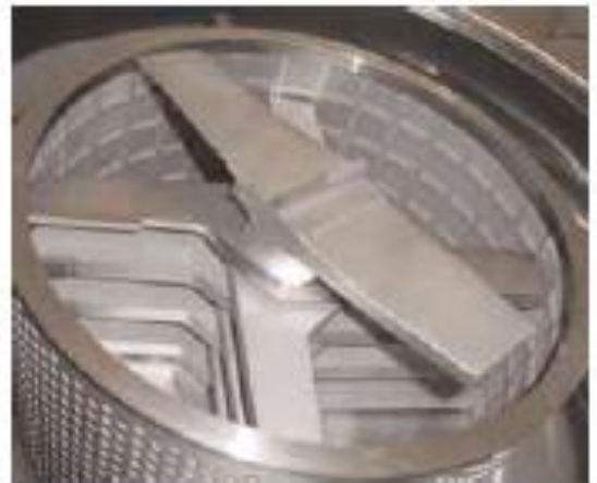
보조 Rotor를 보여주는 기존 레이아웃